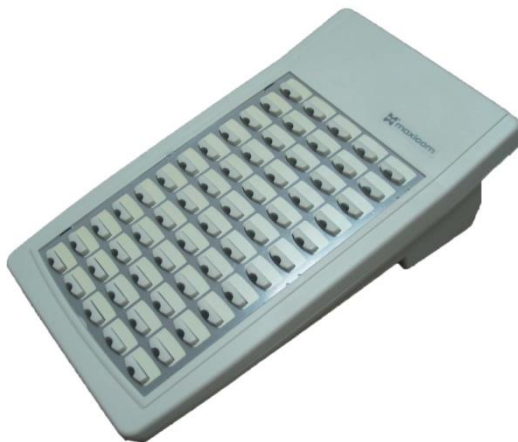
Рис. 2 Дополнительная консоль MAXICOM™ KSTA60.

Дополнительная консоль MAXICOM™ KSTA60 (далее консоль, КСТА) используются для расширения поля программируемых кнопок СТА – каждая консоль добавляет 60 таких кнопок. KSTA60 выполнена в стиле конструктива системного телефона STA20, незначительно отличающегося по внешнему виду от STA30 (см. Рис. 2).