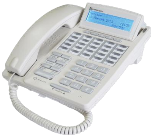
Рис. 1 Системный телефонный аппарат MAXICOM™ STA30.

Модификация аппарата STA30m предоставляет пользователю возможность подключить внешний настольный микрофон вместо встроенного микрофона спикерфона (см. п. 4.1 данного Приложения).